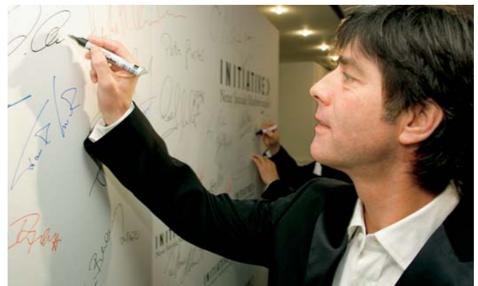
Viele Prominente aus Sport und Politik hinterließen ihre Autogramme an der INSM-Unterschriftenwand: hier Nationaltrainer Joachim Löw.

„Die INSM unterstützt die Aktion, weil die Preisträger mit ihrem sozialen Engagement Vorbilder für die Gesellschaft sind und es zudem viele Parallelen zwischen dem Sport und der Wirtschaft gibt: Erfolg kann es nur mit fairen Startchancen, unverfälschtem Wettbewerb