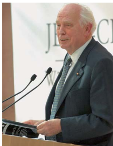
Gerührt: INSM-Kuratoriumsvorsitzender Hans Tietmeyer bedankte sich für die Ehrungen.

Zum Geburtstag veröffentlichte die INSM gemeinsam mit der Finanzzeitschrift EURO eine Sonderausgabe des Magazins, die das Leben und Wirken Tietmeyers würdigte. Das Sonderheft enthält zahlreiche Beiträge von Weggefährten, Freunden und Angehörigen Tietmeyers - darunter Bundespräsident Dr. Horst Köhler, EZB-Präsident Jean-Claude Trichet,