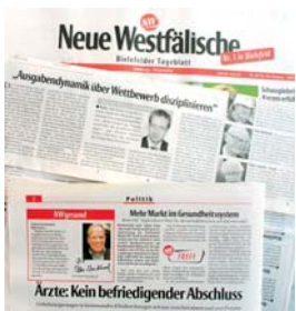
Resonanz auf das INSM-Gesundheitspodium in Bielefeld.

http://www.insm.de/Veranstaltungen/Rueckblick_2006/Rueckblick_2006/Bericht_ueber_die_Sprechstunde_mit_Bernd_Raffelhueschen_in_Bielefeld.html