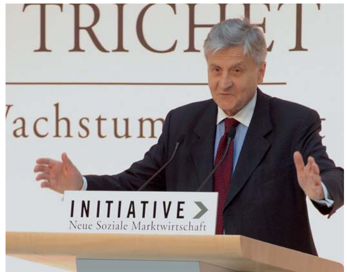
Jean-Claude Trichet als Hauptredner bei der V. Ludwig Erhard-Lecture der INSM am 16. Oktober 2006 in Berlin.

Berlin – Selten sah man Hans Tietmeyer so gerührt wie am 16. Oktober bei der V. Ludwig-Erhard-Lecture der Initiative Neue Soziale Marktwirtschaft. Diese fand statt zu Ehren von Tietmeyers 75. Geburtstag. 350 Anwesende hörten zu, wie Hauptredner Jean-Claude Trichet, Präsident der Europäischen Zentralbank, zugleich Vertrauter und Freund des früheren Bundesbankpräsidenten, seinen „Freund Hans“ ansprach: „Ich schätze mich persönlich glücklich und bin stolz