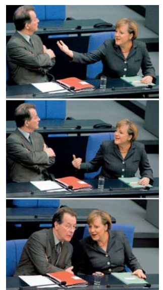
Prima Klima in der Koalition – doch stimmt die Leistung?