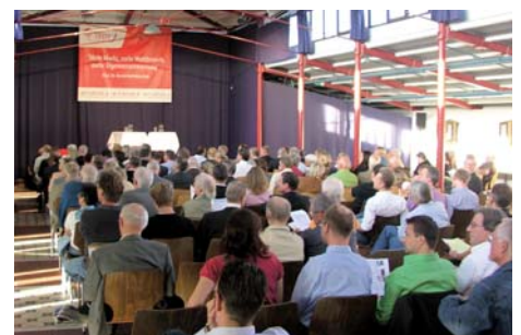
Rund 270 Zuschauer in der alten Spinnerei verfolgten die Ausführungen von Bernd Raffelhüschen.

Drinnen im Saal gelang es dem gelockten Gelehrten mit lockeren Formulierungen schnell, die rund 270 Zuschauer in seinen Bann zu ziehen. Mit Sätzen wie solchen: „Egal, ob Kopfpauschale oder Bürgerversicherung – unser Problem ist, dass wir seit den 70er Jahren zu wenig Köpfe und zu wenig Bürger produziert haben.“ Damit sprach Raffelhüschen die Alterung der Bevöl- ➤