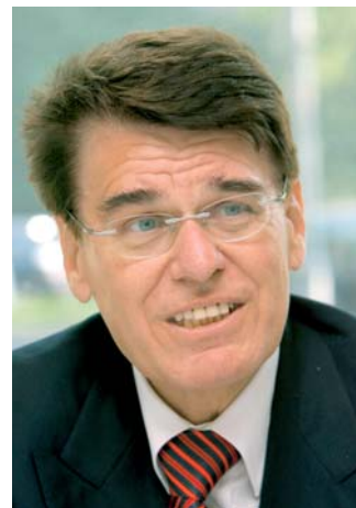
Düsseldorfs OB Joachim Erwin sah das Ranking der INSM als Anstoß zum Handeln.

Interessanter noch war die breit gefächerte Debatte über die Stärken und Schwächen der Regionen, die das Ranking über die Einzelindikatoren bundesweit vergleichbar offenlegte. Düsseldorfs Oberbürgermeister Joachim Erwin (Foto) reagierte prompt auf das INSM-Ranking. In einem Brief an den Polizeipräsidenten forderte Erwin dazu auf, einen runden Tisch zur „Verringerung der Kriminalität in Düsseldorf“ ins Leben zu rufen. Grund: Die ansonsten hervorragend bewerte-