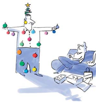
... über mehr Wachstum nachdenken?