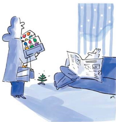
Warum nicht einmal in Ruhe ...