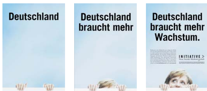
Für mehr Wachstum und Beschäftigung ließ die INSM die Kanzlerin in einer scherzhaften Fotomontage Klimmzüge machen.

„Deutschland...“, „Deutschland braucht...“, „Deutschland braucht mehr Wachstum“ – in einer dreiteiligen Anzeige der INSM macht Angela Merkel – natürlich nur in einer scherzhaften Fotomontage – Klimmzüge für mehr Wachstum. Ein heiteres Motiv mit ernstem Hintergrund, denn Deutschland braucht mehr wirtschaftliche Dynamik, damit neue Jobs möglich werden. Das Motiv wurde am 18. September unter anderem in der FAZ sowie im Focus veröffentlicht.