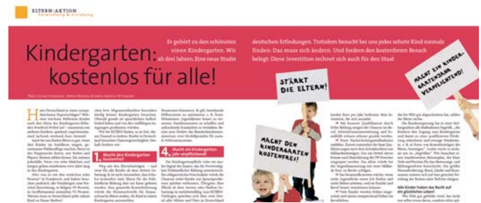
In diesem Artikel befasste sich die Zeitschrift ELTERN in ihrer am 12. Dezember erschienenen Ausgabe mit der INSM-Studie.

lifizierung die Jugenderwerbstätigkeit zunehmen. Auch daraus ergeben sich positive steuerliche Effekte. Durch eine Herabsetzung des Einschulungsalters um ein Jahr könnte der Staat schließlich etwa 2,9 Milliarden Euro jährlich einsparen.