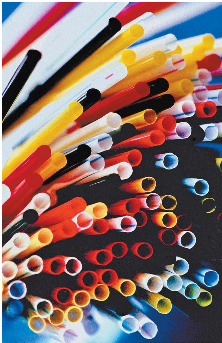
Bunte Trinkhalme aus Kunststoff: Das sogenannte Polypropylen produziert ein Beteiligungsunternehmen der BASF (o.). Das jährliche Sommerfest Rhein in Flammen : Hier erleuchtet ein Feuerwerk das Kaiser-Wilhelm-Denkmal in Koblenz